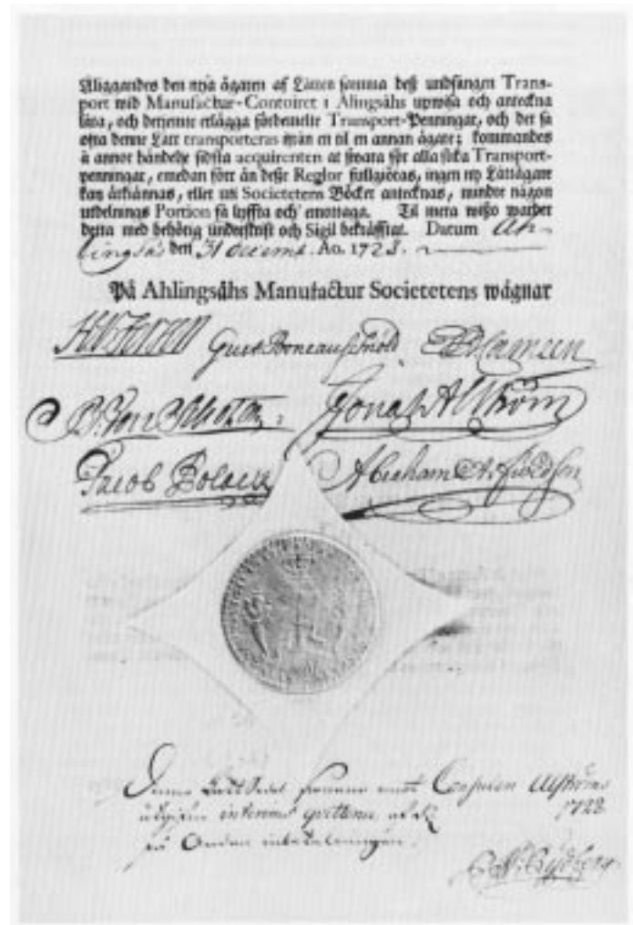
Det äldsta aktiebrevet som vi känner till är Alingsås Manufactur Societetens från år 1728.